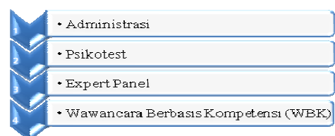
Gambar 2. Tahapan seleksi

PT. ABC merupakan salah satu Badan Usaha Milik Negara yang proses bisnisnya yakni mendistribusikan listrik nasional. Seperti perusahaan-perusahaan lainnya, PT. ABC memiliki departemen SDM yang bertugas mengelola karyawan baik dalam hal perekrutan, pemberian hukuman disiplin, dan juga seleksi jabatan. Dalam melakukan seleksi jabatan, terdapat beberapa tahapan yang harus dilalui beserta kriteria-kriteria yang harus dipenuhi oleh calon peserta seleksi. Tahapan yang dilakukan pada PT. ABC adalah digambarkan seperti pada Gambar 2.