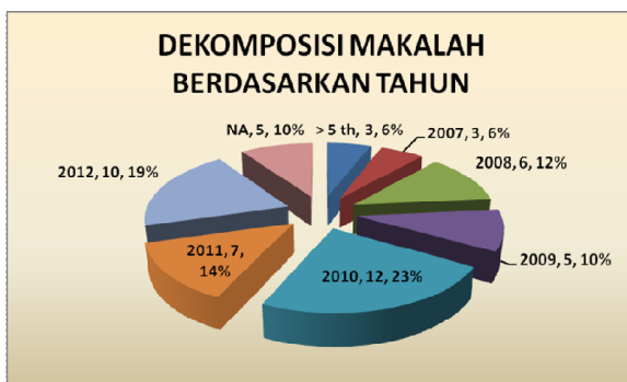
Gambar 3. Dekomposisi Makalah